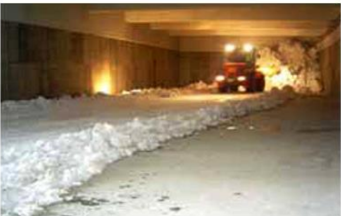
札幌市山口斎場 雪冷房写真