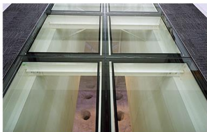
北海道洞爺湖サミット国際メディアセンター 環境ショールームから見た雪室

札幌市山口斎場では、貯雪した雪に散水することで冷水を作りだし、その冷水から空調用冷水へ熱交換機を介して冷熱を供給し空調に利用しています。