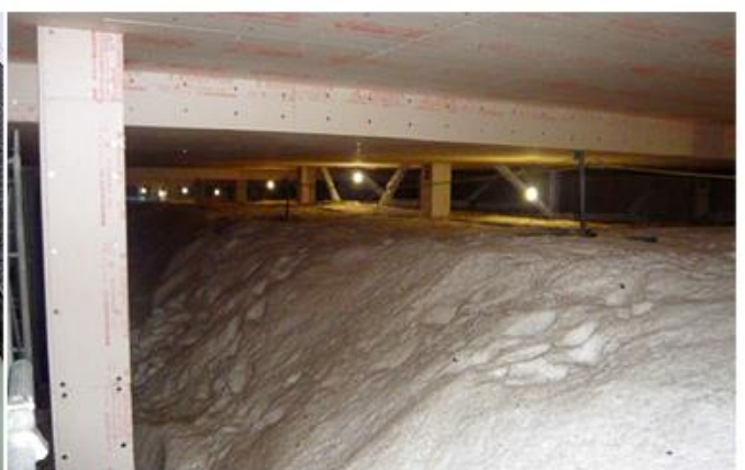
北海道洞爺湖サミット国際メディアセンター 雪室