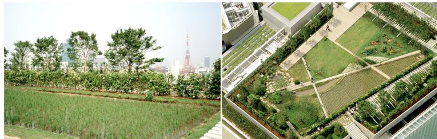
六本木ヒルズけやき坂コンプレックス 屋上庭園

六本木ヒルズけやき坂コンプレックス、富士通ソリューションズスクエアでは、屋上庭園の荷重を利用した制振装置（グリーンマスダンパー）により、本格的な屋上庭園と耐震安全性を確保しています。また、グリーンマスダンパーは、屋根面の自然対流を誘引し熱負荷を軽減します。